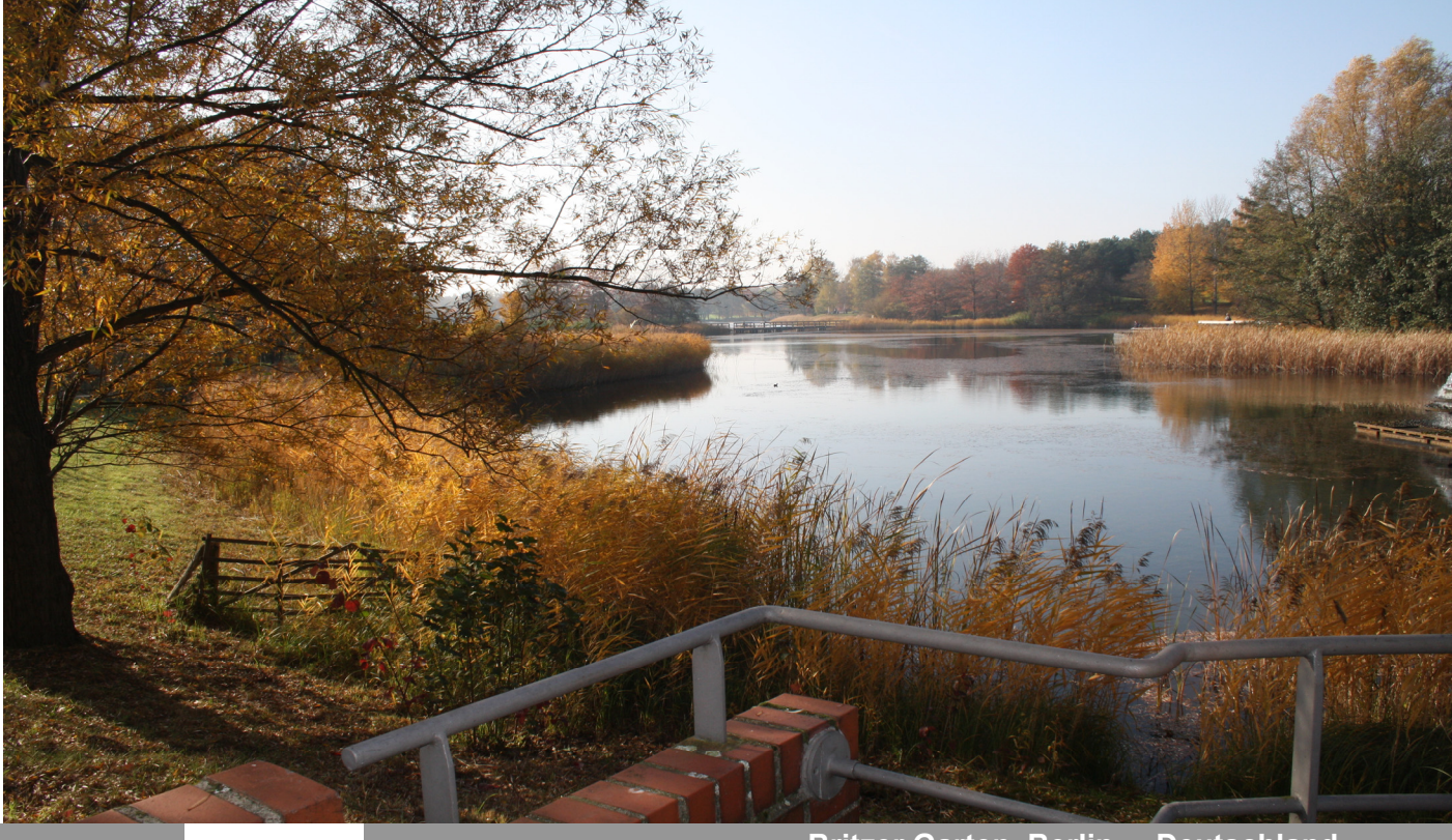
Britzer Garten, Berlin – Deutschland

Standort: Berlin – Deutschland Projekt: "Regenwasserbewirtschaftung im Britzer Garten"; Vorplanung 2011 Größe: 80 ha (ehemaliges BUGA-Gelände)